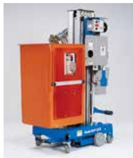
标准玻璃纤维平台* 74×67 厘米适用于常规作业的玻璃纤维设计，可容纳工具和物料。