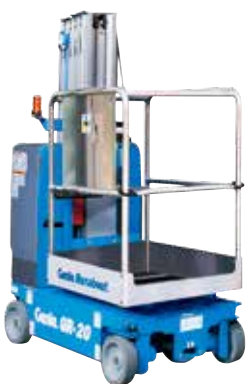
货物采集平台 89×73 厘米提供双侧进入门和前折叠托盘。