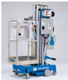
门式窄型平台 66×51 厘米可通过天花板和其它狭小的开口。