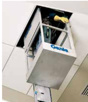
窄型平台选项 是进入天花板贴砖上部空间的完美之选。