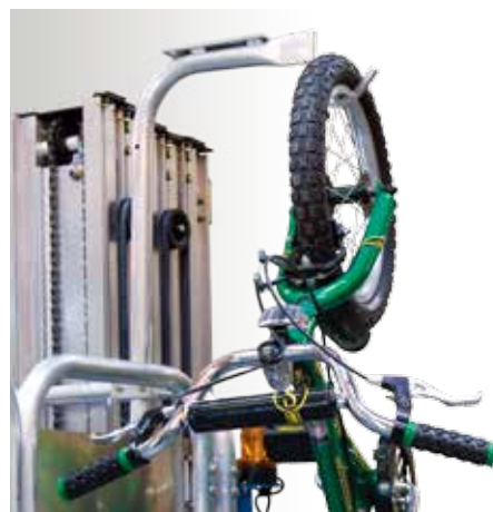
货物采集型 (QuickStock) 自行车托架

方便升降置于高处或仓库货架上的自行车—无需操纵者在平台内提举，控制或托住自行车，最大可承载 20 公斤的重量。