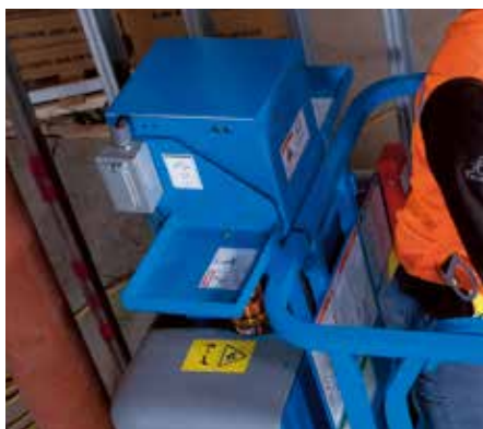
Runabout Contractor 工作托盘