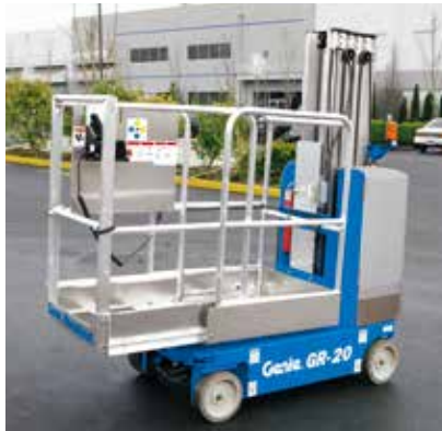
带滑动的中间滑杆式延伸甲板平台 140×75 厘米提供 51 厘米的水平向外延伸和更宽敞的工作平台。