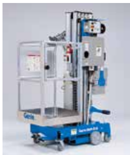
门式标准平台 69×66 厘米一步式进入。