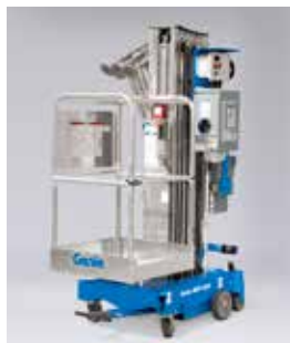
标准平台带有中间滑杆 69×66 厘米出色的常规作业平台。