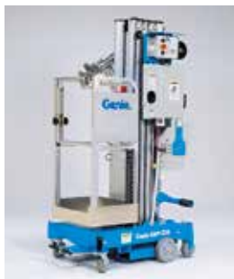
门式极窄型平台 56×46×114 厘米能通过其他狭小开口